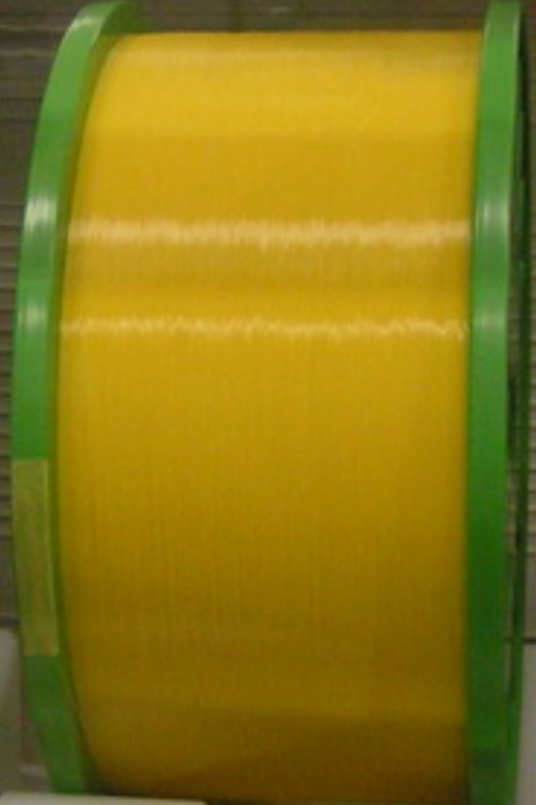
ファイバー心線 着色済